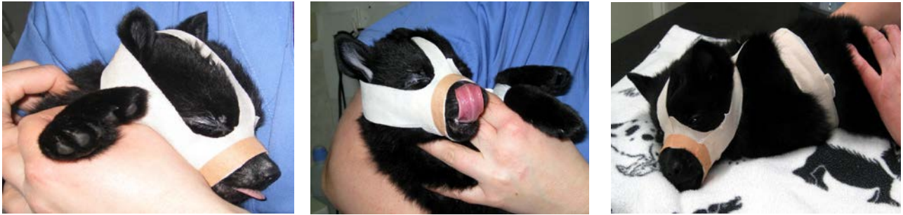
Kuvasarja 3: Lisätueksi ja esineiden pureskelun estämiseksi pennulle rakennettiin yksilöllinen kuonoside. Kuonositeen kanssa pentu pystyi juomaan ja lipomaan pehmeää ruokaa.